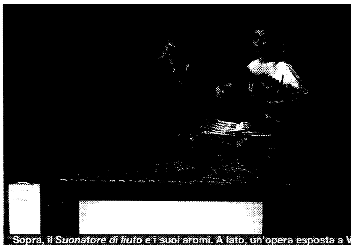
Sopra, il Suonatore di liuto e i suoi aromi . A lato, un'opera esposta a Venezia.