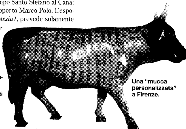
Una "mucca personalizzata" a Firenze.

sala del teatro. L'iniziativa è valida per tutti gli spettacoli della stagione. Occorre prenotare almeno 24 ore prima. Il costo: 15 euro a bambino. Tel. 031270170. www.teatrosociale.com.it .