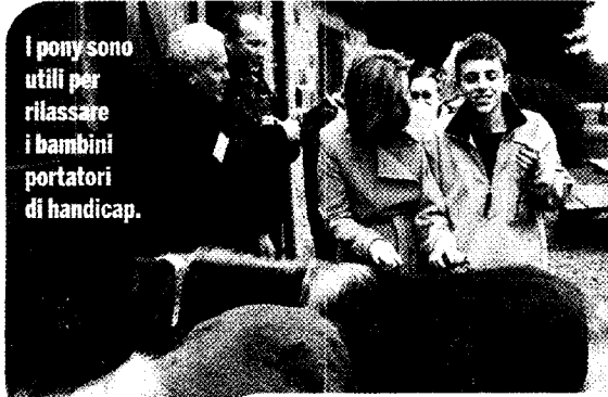
I pony sono utili per rilassare i bambini portatori di handicap.

indimenticabili vacanze ai bambini handicappati. Dopo aver incontrato i piccoli ospiti, la visita di Sophie si è conclusa con il classico tè delle cinque. La Rhys-Jones ha voluto visitare ogni angolo della fattoria, dove sono allevati animali che vengono anche