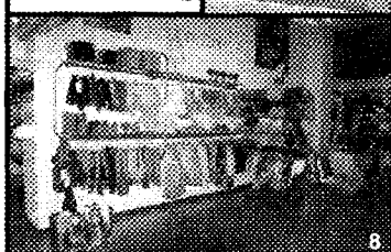
1. BABY DIOR 2. 3. PINCO PALLINO 4. 5. 6. NATURINO 7. 8. SIMONETTA